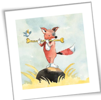
Illustration Helme Heine

Mit dem Thema „Speisen erzählen Geschichten“ und der Geschichte „Die Rose von Jericho“ erzählen die Mandelanerinnen und Mandalaner was für sie unbedingt zum Frühling gehört.