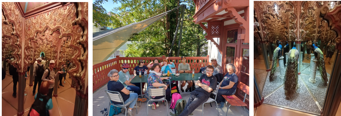
Mandala - Ausflug 2025

Wir besuchen den Gletschergarten in Luzern. Dabei entdecken wir die neue Felsenwelt, besuchen das Spiegellabyrinth. 90 Spiegel sorgen für absolute Verwirrung.